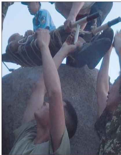
▲四五米高的巨石给救援带来不小的难度。

然而销售人员称,展示的粽子和买到的“肯定不一样”,但肯定会有的大枣的粽子,只是要碰运气。