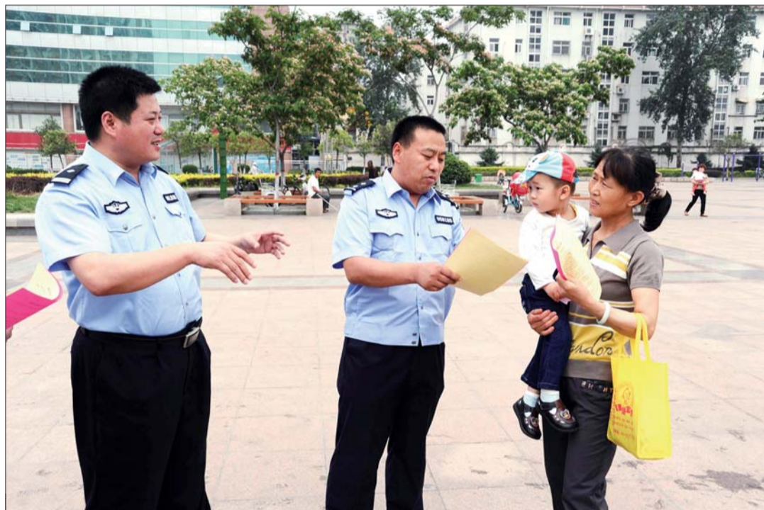
13日,邹城市公安局开展以“关爱儿童、反对拐卖”为主题的打拐宣传活动,民警深入学校、繁华地段和游乐中心向市民讲解怎样识别人贩子等常识,提高广大市民和小学生自我保护能力。图为两名民警在散发防骗常识明白纸。

东宏河圣齐生物工程有限公司和济宁鲁淀生物有限公司为依托的生物制造基地;以中材泰山玻纤、百隆纺织和山东恒沃科技有限公司为依托的新材料基地;以规划中的宏河200万吨造纸项目为依托的新型造纸基地。荣信焦化实现销售收入突破100亿元,实现利税1.16亿元,成为山东省煤化工行业龙头。中材集团泰山玻纤邹城公司总产能40万吨,居国内前三、世界前五,实现销售收入9.5亿元,利税1.5亿元,出口创汇3600万美元。