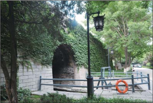
北水门保护相对完好。