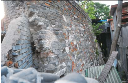
西城根街还保留着济南唯一一段老城墙。