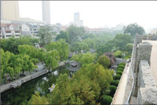
黑虎泉前的护城河。