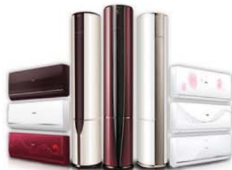
海尔空调明星家族