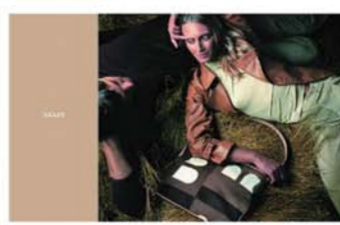
2000年秋冬系列 Busy-B 广告画面