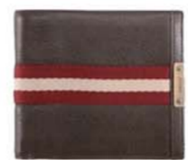
Bally 2009年春夏款 Trainspotting 男士钱包

象征品质与优雅的Bally品牌,于1851年在瑞士创立,在创始人Carl Franz Bally先生不朽的先驱精神的推动下,不断激发创新理念、完善精湛工艺,至今已经走过了162年。1976年Bally将产品范围从时尚鞋履拓展到手袋、皮具配件及成衣,从精美的布洛克花纹、包袋皮革的柔软触感,到外套的经典细致剪裁以及Bally鞋跟的优雅线条,每一件产品都体现了Bally对于完美的追求。2000年,Bally推出其标志性的字母B印花Busy-B系列及经典红白条纹Trainspotting系列,成为经久不衰的畅销产品。