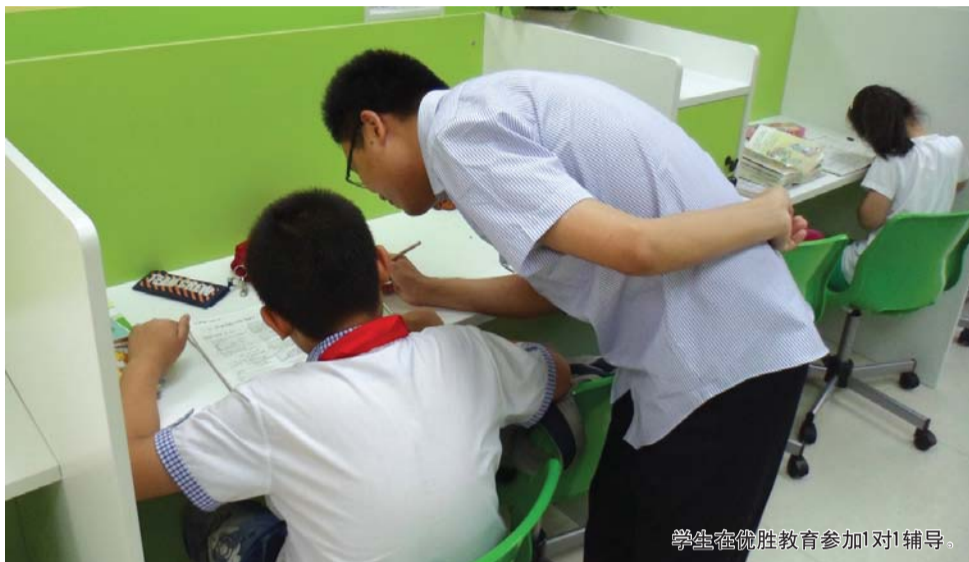
学生在优胜教育参加1对1辅导。

不同于家教一对一，在大教室里分出格子间由老师单独辅导，这是近几年在泰安比较流行的辅导方式，一个老师辅导一个孩子，诊断学习问题，制定补习方案。这种学习模式让家长尤其偏爱，即使价格较大班辅导贵，仍挡不住家长的热情。专家建议，可根据孩子自身情况选择辅导方式，学习成绩稍好的学生，也可选择小班。