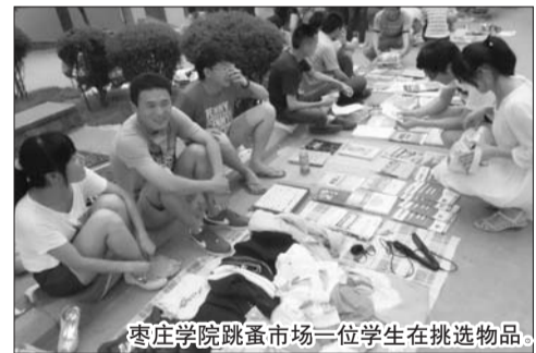
枣庄学院跳蚤市场一位学生在挑选物品。

本报枣庄6月20日讯(见习记者 郑雅莉 通讯员 相飞) 为加强大学“跳蚤市场”的建设和管理,规范市场行为,维护正常的市场交易秩序,为广大毕业生提供交易二手物品的平台,保护毕业生的合法权益,根据全国普通高校的相关规定,枣庄学院于6月19日举行了毕业生“跳蚤市场”交易活动,受到广大毕业生的欢迎。