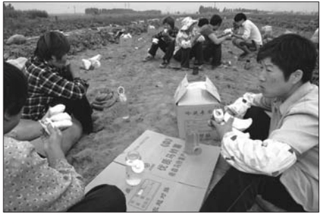
▲土豆地里啃着大包子,就是一顿早餐。