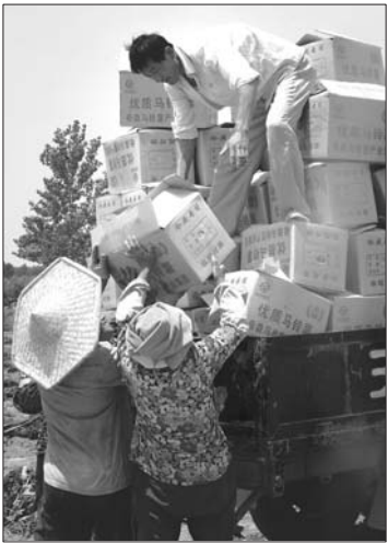
▲搬起50斤重的箱子,女人们一点都不含糊。

著名画家梵高有幅名画《吃马铃薯的人》,画的是在昏暗的油灯下吃马铃薯的乡下穷人。画里给穷人填肚子的马铃薯而今卖出肉价,滕州种马铃薯的农民靠着勤劳和智慧,土里刨金,让不少城里人都艳羡不已。