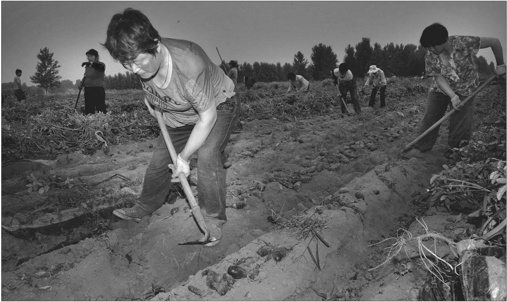
▲早上5点多,她们已经干了将近3个小时的活。