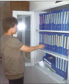
东山街道工作人员展示戒毒人员四色档案。

袁某曾在芝罘区经营一家游戏厅,生活上悠闲自在,衣食无忧。后来因染上毒瘾无法自拔,经营多年的游戏厅倒闭,妻子无法接受现实,与他离婚。 与妻子离婚后,袁某终日用毒品麻醉自己,一旦毒瘾发作,就像发疯似的寻找毒品,还经常出