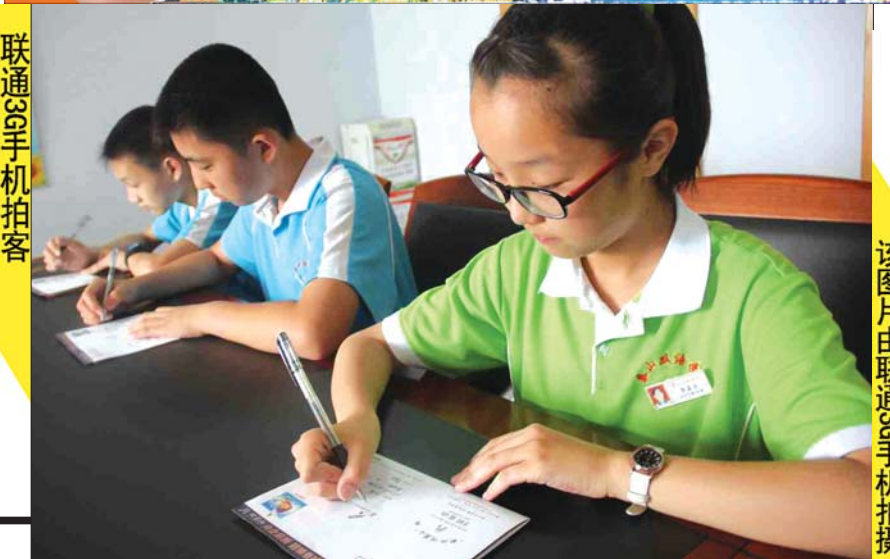
该图片由联通3G手机拍摄