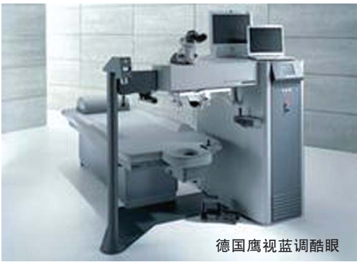
德国鹰视蓝调酷眼

★德国蔡司全飞秒：世界排名第一，全球最先进的近视治疗系统，德国蔡司VisuMax全飞秒是一项革命性技术，也是目前全球所有设备中唯一能够开展全飞秒激光近视手术的治疗系统。全飞秒实现了前角膜完好无损，是目前创伤最小的近视激光手术，安全性得到了前所未有的保障。是美国太空总署和军方批准可用于航天员和飞行员的手术方式，并通过了美国FDA的认证。尤其适合军人、公安、运动员等特殊工种人群。