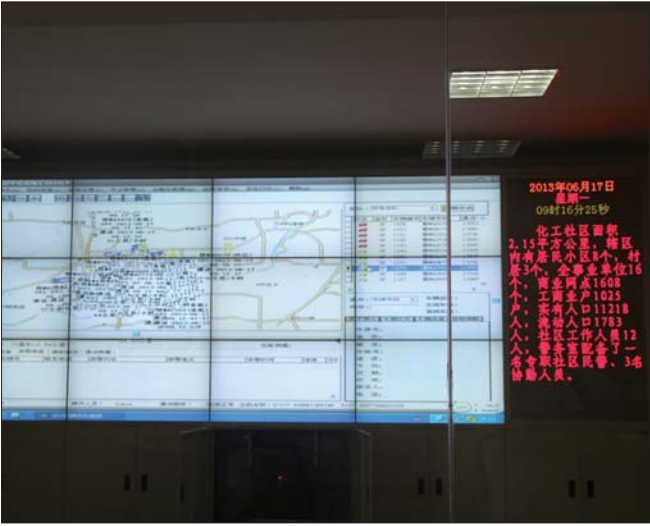
出租车运行全程监控图。

运行了几个月后，出租车司机对这种做法很满意，捡到钱包主动和派出所民警联系，发现线索第一时间联系民警，达到了双