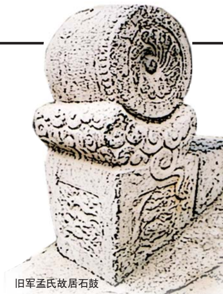
旧军孟氏故居石鼓

孟氏“祥”字号是名扬海右、声誉齐鲁的豪门望族,其发源地就在山东章丘市刁镇旧军村,当地人俗称“旧军孟”。笔者曾十几次到旧军采访,每次都有新的发现,也深深感受到孟氏家族昔日的辉煌和孟氏庄园潜在的历史文化资源开发前景。