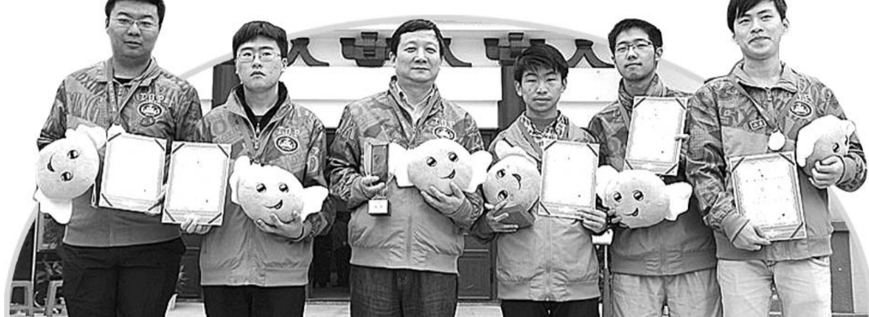
曹大元(左三)和弟子们将为棋迷献上精彩对局。

比赛冠名“西侯幽谷杯”,由泗水县人民政府和齐鲁晚报棋院主办,山东火炬集团、济宁西侯幽谷风景区承办。据悉,比赛结束后,曹大元、江维杰、周睿羊、范廷钰等国手还将参观西侯幽谷,与棋迷们进行其他互动活动,并为西侯幽谷全国棋类基地揭牌。