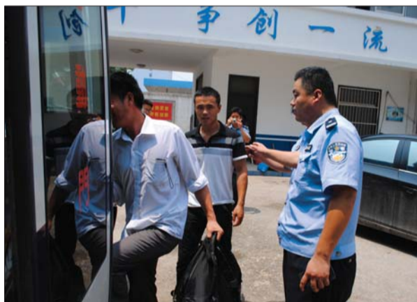
民警送被解救的乘客到车站乘车回家。