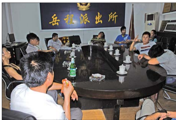
部分获救乘客在派出所会议室休息。