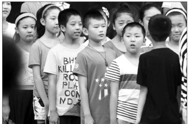
聊城一群孩子排队准备离开培训班。

枣庄市教育局工作人员告诉记者,为禁止在职教师利用暑假办班收费、从事有偿家教行为,教育局曾出台文件,其中规定对于违规补课问题,一经查实,要按照相关规定严肃处理。如果家长发现在职教师假期办班补课,可拨打电话进行举报。