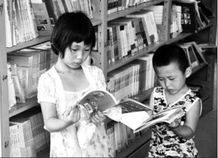
▼学校青少年宫定时开放,大悦借书看。