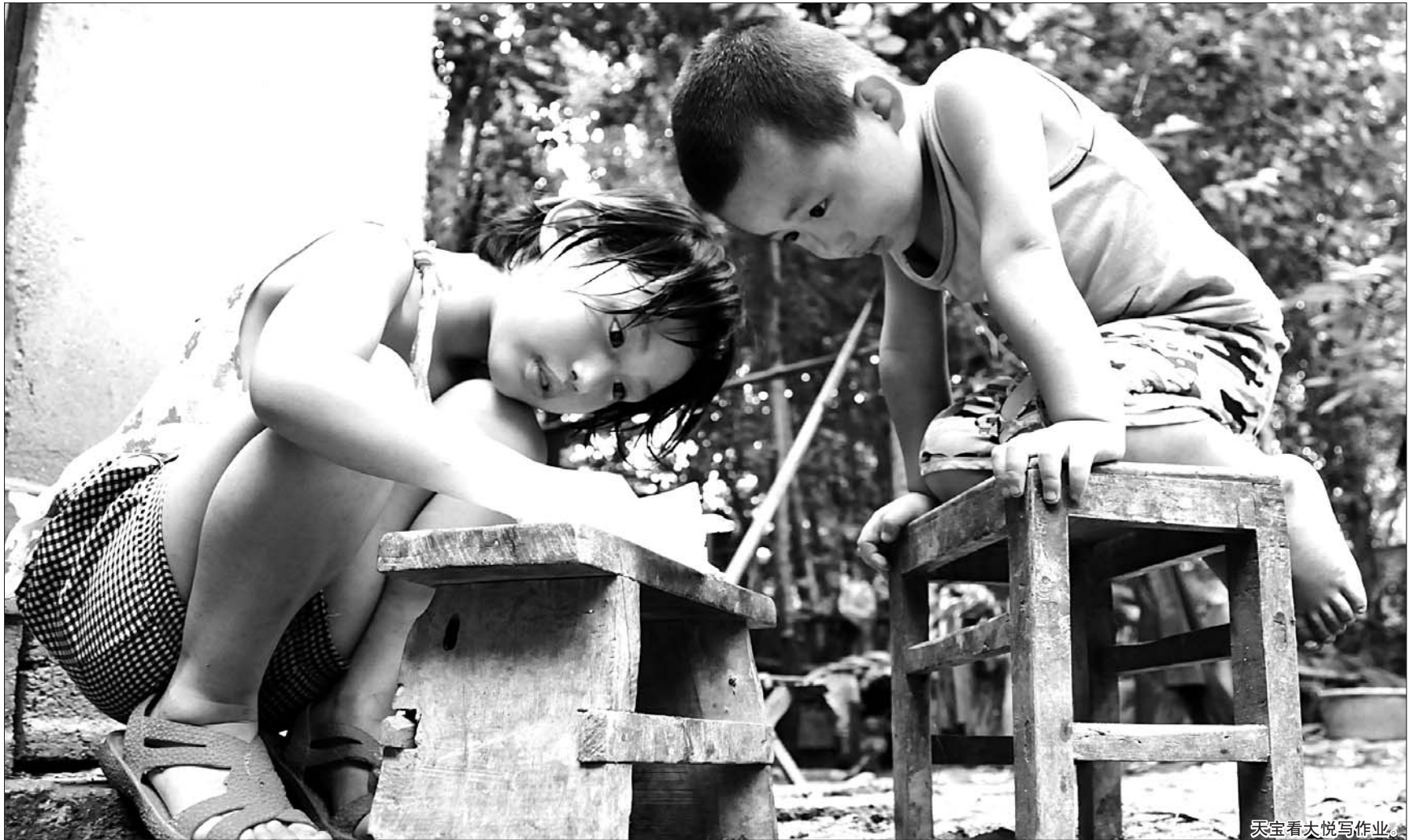
大宝看大悦写作业。