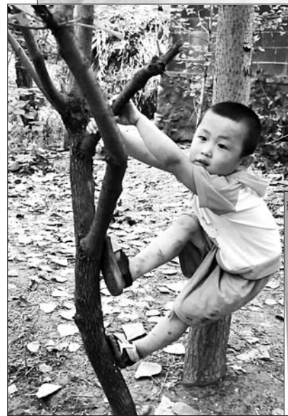
◀小树成天宝“练武”的地方。