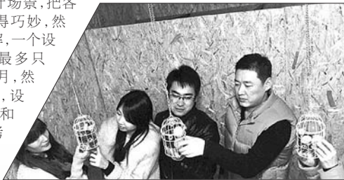
鸟笼里的台球数字暗含着开启大门的密码。

乐趣就是设计场景，把各个线索埋藏得巧妙，然后再互相破解，一个设计好的房间最多只能持续几个月，然后推倒重来，设计新的主题和场景，继续考验设计者和玩家。