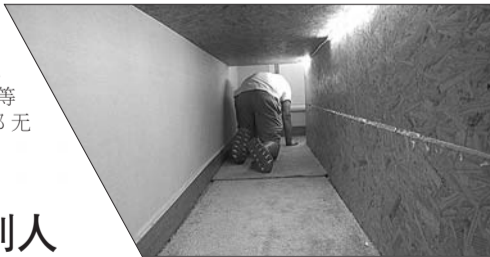
房间内的逃生密道很难被发现。