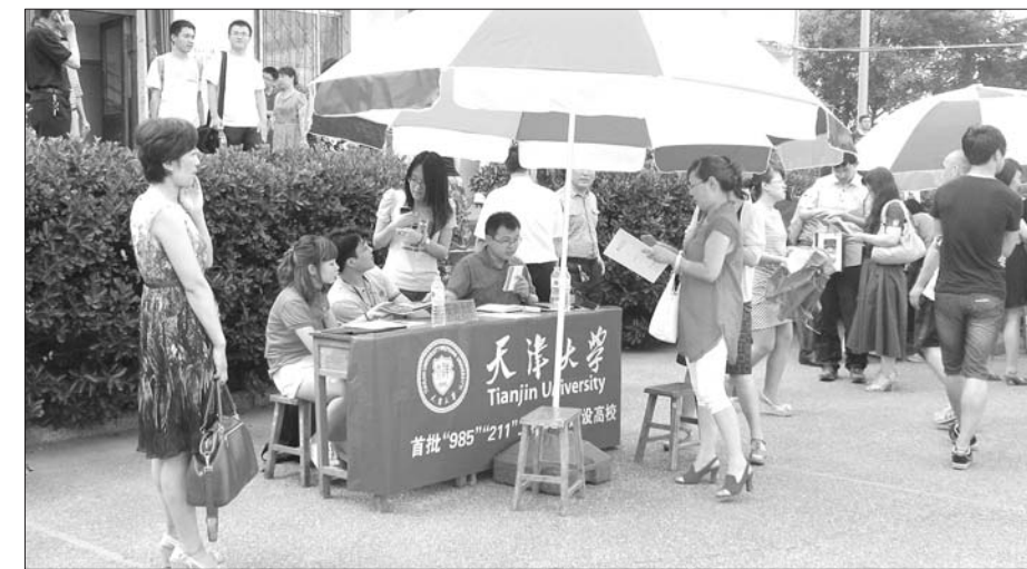
在山东招生的一本高校超九成“吃饱”(资料片)。

从数据可以看出,经过本科一批一志愿录取后,文科尚未录满的高校只剩10所,理科尚未录满的高校也只剩15所,数量创历年最低。而在2012年未实行平行志愿的年份,普通文理类本科一批一志愿投出后,尚有普通文科62所、普通理科46所院校生源不满。