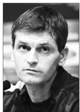
比拉诺瓦从巴萨离职。

曾担任巴萨助理教练的比拉诺瓦于2011年11月被诊断出患有胰腺癌,在治疗成功后回归球队教练组。2012年4月,俱乐部确认其将作为瓜迪奥拉的接班人在赛季末接手球队主教练一职。然而同年12月,比拉诺瓦再度病发,不得不暂停手头工作接受手术。2013年3月,经过休养的比拉诺瓦回到巴萨,并带领巴萨拿到俱乐部历史上第22个西甲冠军。