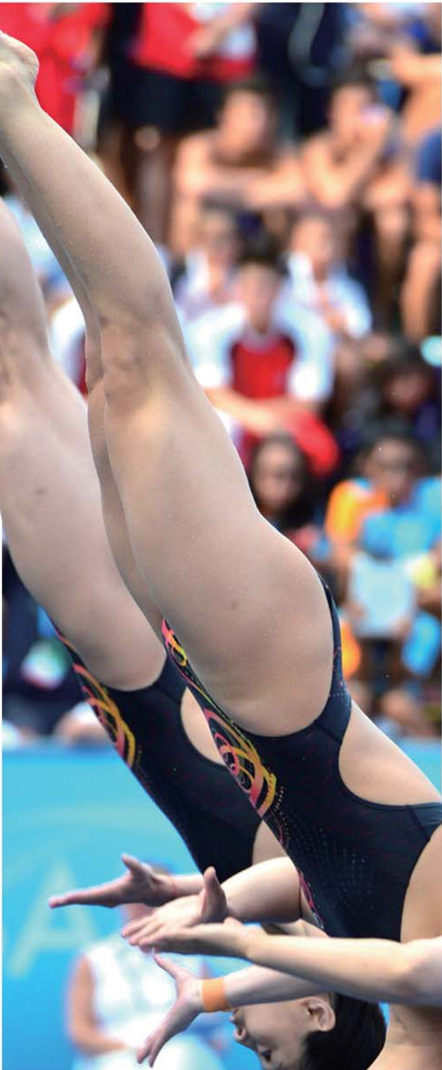
▲吴敏霞(左)/施廷懋在女子双人三米板决赛中摘金。

当被问到她会不会像伏明霞和郭晶晶那样嫁入豪门时,吴敏霞给出的始终是一个答案:“我不知道啊……我觉得自己的幸福决定权在自己的手里。我不希望给自己太多的压力或者固定某一个选择。我觉得一切随缘,一辈子的幸福不用急于一时。”