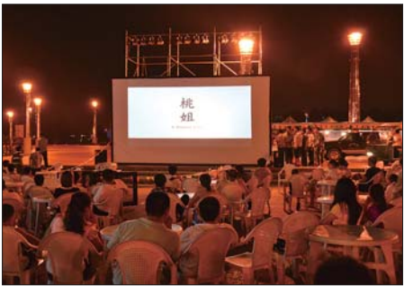
19日晚,表演结束后太阳广场播放了电影《桃姐》。