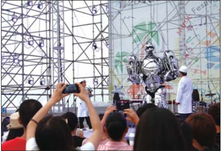
机器人与观众见面。