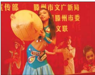
小选手在表演民族独舞

目前,报名还未截止,并且已经有来自滕州市区以及乡镇的一千多名市民报名参加比赛,报名过程中不收取任何费用。