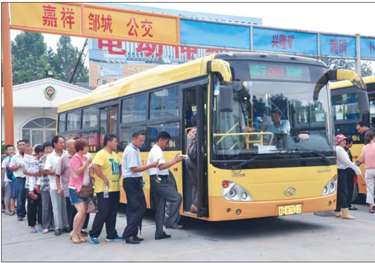
市民排队乘坐城际公交。

即便时常想家,也只能每月回家一两次。自从邹城开通城际公交后,由于回家票价只需4元,所以现在她最少每周也要回一次家和家人团聚。 记者了解到,为了方便旅客出行,济宁城际公交客运有限公司根据乘客建议不断对站点设置进行完善。从6月26日城际公交正式投入运营以来,相继增加了邹城南路的鸿源石化、郑庄、马街、鲁抗产业园、荣信煤化、郭里路口、落陵和北宿中学多个站点。同时,邹城中路也增加了中国重汽、文博园两个站点。截至目前,邹城南路沿途共设有26个站点,邹城中路沿途站点也增加至23个。