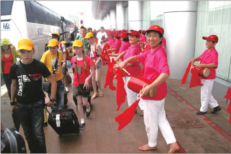
机场外,腰鼓队热情表演,欢迎150位俄罗斯游客来烟。

“俄罗斯是烟台八大旅游客源地之一,哈巴罗夫斯克是俄罗斯远东地区的最大城市,毗邻中国东北,冬季寒冷且长,极度渴望沙滩和阳光,是烟台理想的俄罗斯入境市场客源地。”烟台市旅游局副局长牟云介绍,为进一步开拓俄罗斯入境市场,市旅游局、市口岸办与烟台国际机场集团以及黑龙江天马旅行社等不断协调与沟通,历时大半年,促成了本次包机直航旅游。