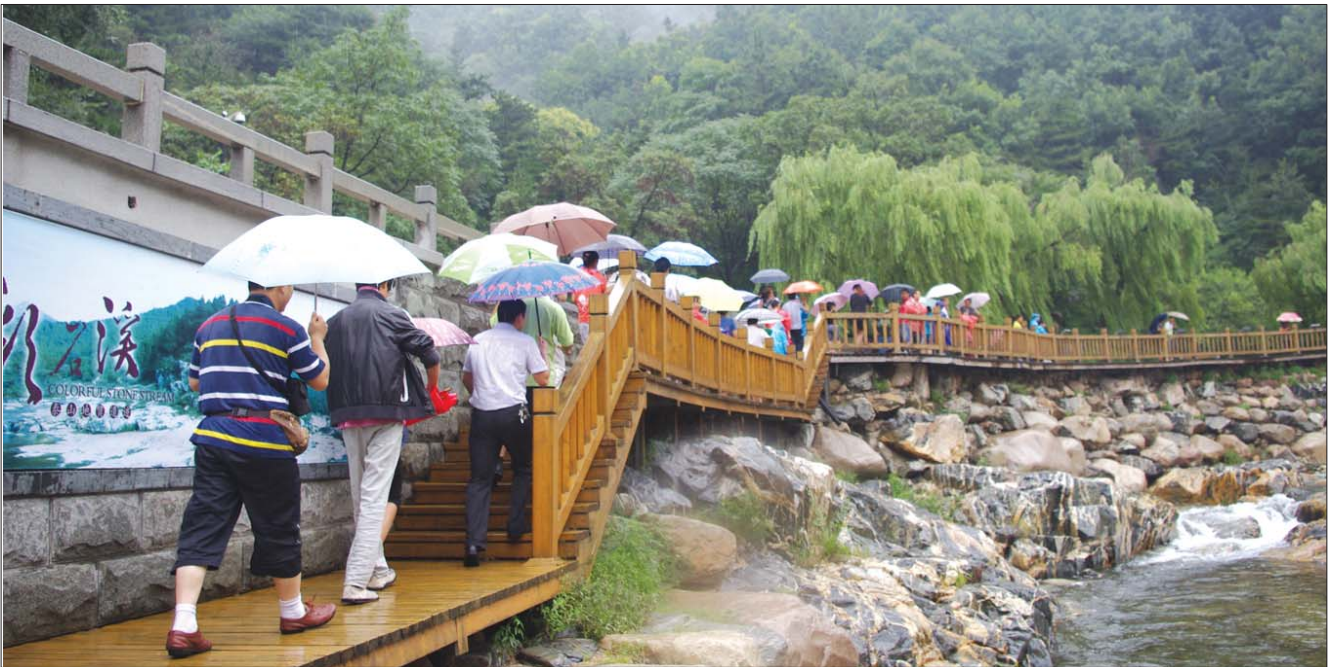
社科院发布的泰安标准旅游花费为580元,这些钱可参加包括泰山景区的所有泰安三日游。

泰安“一天一夜游”580元?在中国社科院旅游研究中心发布的《中国旅游消费价格指数监测报告》中,泰安一天一夜的城市标准旅游花费为580元,在受调查的50个城市中位居第七。对于这个价格,有的游客觉得很贵,有的人则觉得不够。这个“标准旅游花费”是怎么得出来的?580元在泰安玩一天到底够用吗?