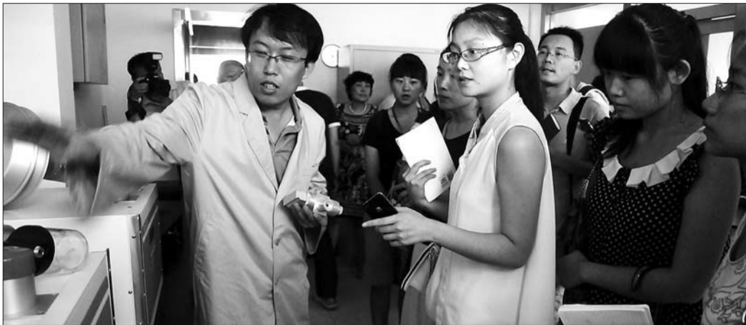
26日,省环保厅启动“环境监测开放日”活动,图为市民参观环保实验室。

26日下午,50名市民代表参加了省环保厅组织的首次“环境监测开放日”活动。在相关专家的讲解下,大家参观了环境质量自动监控系统、空气质控实验室等监测设备,对各项环境数据有了更深的了解。