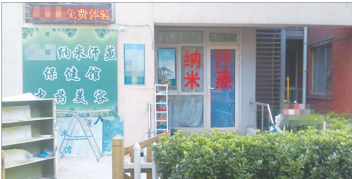
小区类似的汗蒸馆不少。

许多人以为汗蒸时间越长效果越好。其实这是个误区。汗液出得太多,会引起体液减少,加重心脏负担,所以汗蒸的时间以40分钟以内为宜,汗蒸最多一周一至两次,流汗过多,反而不利健康。