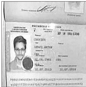
斯诺登的临时避难证。

16日,斯诺登正式向俄提出临时避难申请。斯诺登滞留机场中转区一个多月以来,美方持