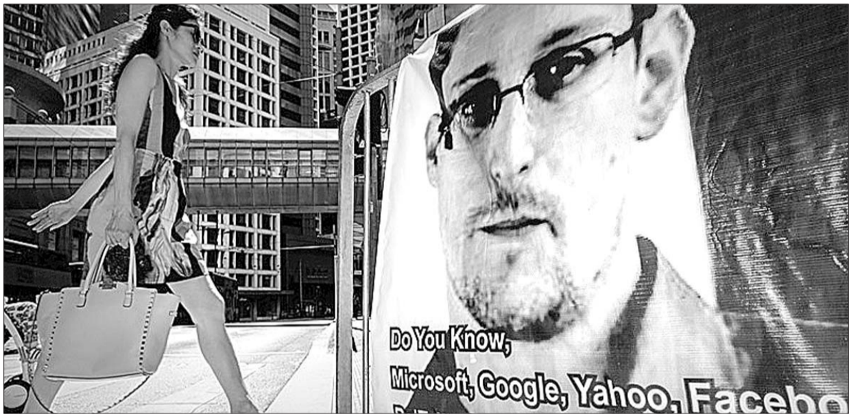
一位女士走过街头印有斯诺登照片的海报。(资料片)

前一种选项中,陆军人数将继续缩减为38万至45万人;海军航空母舰数量从11艘减至8或9艘;海军陆战队人数减为15万至17.5万;空军退役一批老旧轰炸机。美联社评述,这样一来,美国海军航母数量将为第二次世界大战以来最少,陆军规模至少为1950年以来最小。