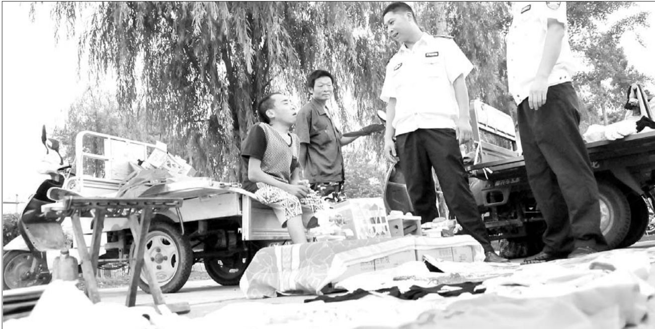
在免费经营区域,城管、摊主关系很和谐。