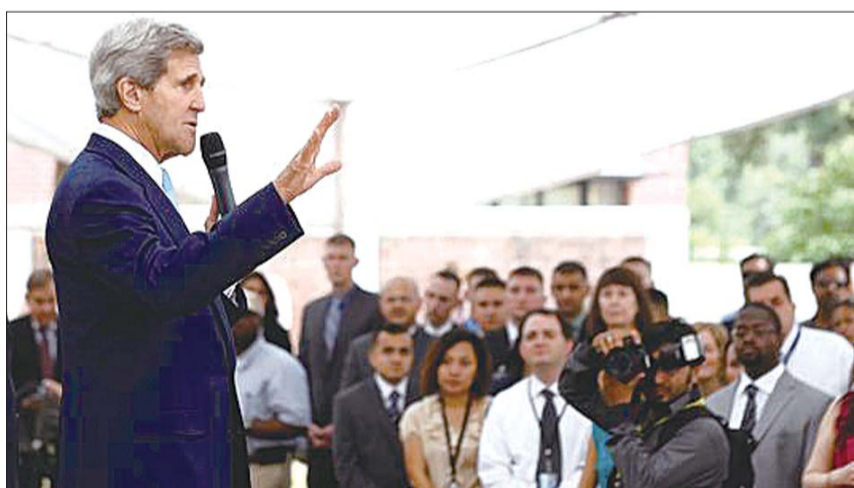
1日,美国国务卿克里在巴基斯坦伊斯兰堡使领馆发表讲话。

多名美国官员说,这是多年来最具体的恐怖袭击威胁。美国总统贝拉克·奥巴马下令,采取“一切措施”,保护美国人员和设施。