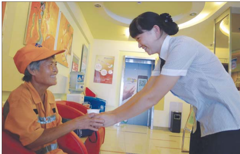
9日,山大北路银座佳怡酒店大厅纳凉点,工作人员为前来纳凉的保洁员端来一杯水。

本报联合济南城管继续面向社会征集,如果您想设立“环卫工纳凉点”,可以拨打本报热线电话96706报名。