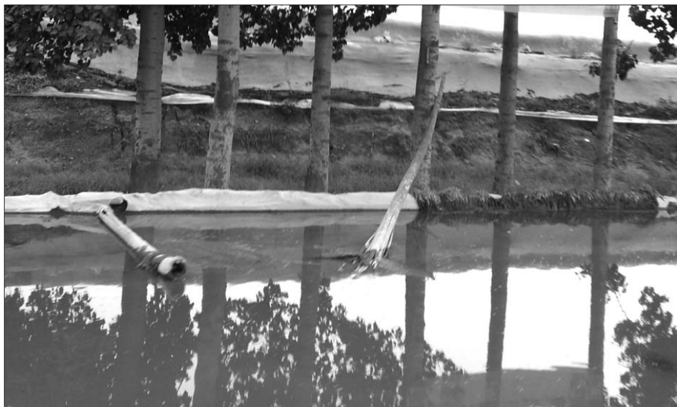
大棚被淹,村民往路上排水。

本报8月11日讯(记者 董惠)前一段时间,潍坊连续遭受高强度降雨袭击。近日,记者采访了解到,受降雨影响,寿光纪台镇地下水位猛涨,超九成蔬菜大棚被淹,有的大棚积水深达1米左右。无奈之下,村民只能往路上排水减轻损失。