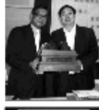
“福寿双玺”被作为国礼赠予泰国领导人,国之重器见证中泰友谊