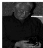
中国工艺美术大师、著名奥运中国印刷篆刻家袁广如