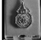
泰国前总理阿披汶授予与会中国代表友谊勋章