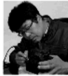
中国著名篆刻艺术大师代全海先生