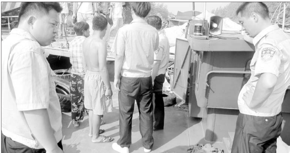
民警拦住肇事货船。

本报济宁8月12日讯(记者路帅 通讯员 韩聪) 11日早7点,一艘满载800吨黄沙的大型运输船撞上了一艘渡船,致使船上一名乘客摔伤,渡船尾部受创。事故发生后,货轮不但没有停船,反而继续向南航行,最终被警方巡逻艇拦下。