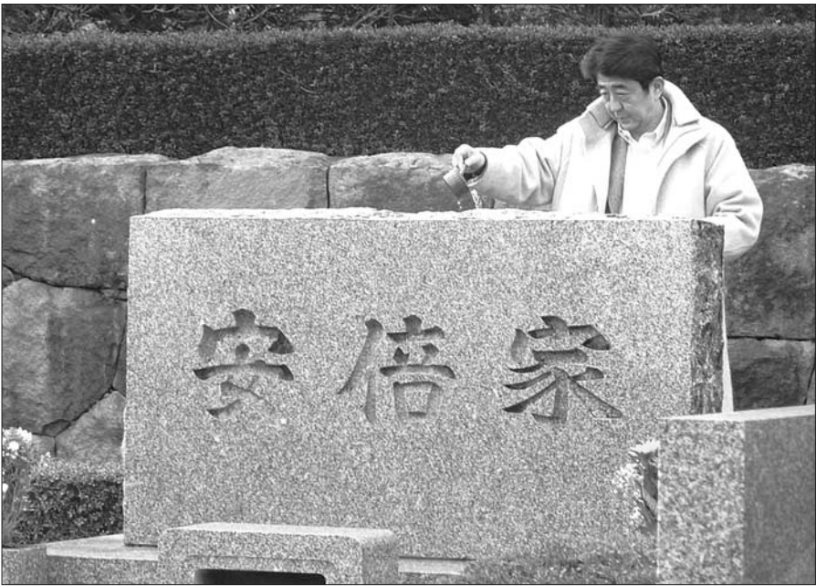
12日，日本首相安倍晋三前往故乡山口县长门市为亡父、前外相安倍晋太郎扫墓。 据产经新闻

本报讯 据日本新闻网报道，日本首相安倍晋三12日在自己的故乡日本山口县长门市表示，修改宪法是自己的历史使命，一定会认真努力实现改宪目标。 安倍是在自己的后援团体主办的晚餐会上作上述表示的。他在演讲中说：“为了修改宪法，我一定加倍努力。这是我的历史使命。” 报道指，这是安倍就任日本首相以来，第一次用“历史使命”这样的强烈语气来表达自己对于修改宪法的决心。 在7月的参议院大选获胜后，安倍对于修宪问题曾表示，要让国民理解和讨论，逐步推进修宪工作。 安倍利用盂兰盆节的假期回故乡给父亲扫墓，并在墓前汇报了在参院选举中获胜一事。安倍随后向长门市的支持者致辞时强调：“我在父亲的墓前汇报了在众、参院选举中获胜一事。但我的志愿还没有实现，从现在起才是关键。” 分析称，此时发表强硬的修宪立场，也预示着安倍在父亲的墓前表达了自己的这一决心。（中新）