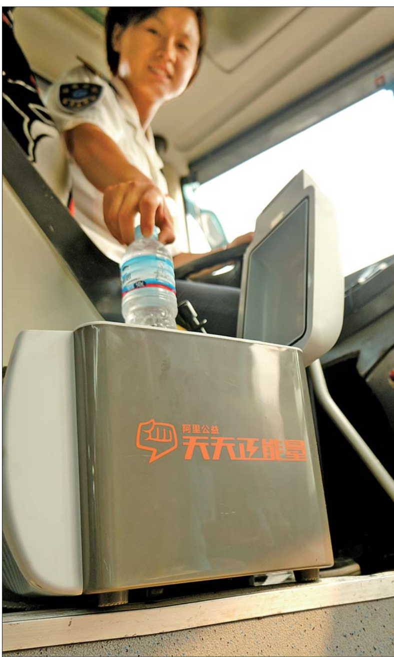
14日,35路公交车开始陆续安装车载冷热箱,这些小小的“正能量箱”将为长时间处于酷热环境中的公交司机带来一丝清凉。