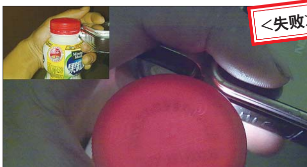
用手电从侧面照射瓶盖,可看到瓶盖内的字迹。

动已过期,记者选取了500ml的康师傅经典奶茶代替。但无论记者如何照射,瓶盖里的字迹怎么也看不见。最后打开一看,却是“畅饮壹瓶”。随后,记者又选择了鲜果粒和果缤纷饮料进行实验,但由于瓶盖外有宣传语遮挡,同样实验失败。看来这种方法并不是那么好使。