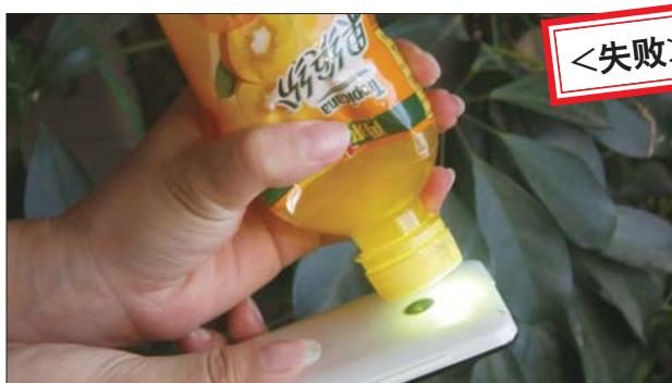
捏扁瓶身,用手电照射瓶盖,看不到任何字迹。

是不是饮料本身的问题?记者又选择较为透明的绿茶饮料,效果也不理想。由于绿茶瓶底有花纹,导致什么也看不清。最后,记者直接用矿泉水做实验,也没有达到网友描述的效果。