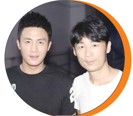
麒麟美业经理齐林与杜淳合影