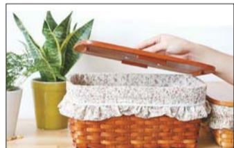
带盖子的藤编篮子,干净整洁。