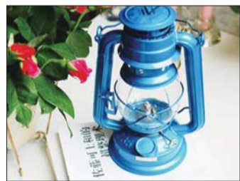
蓝色灯饰,是不是有种怀旧feel呢?