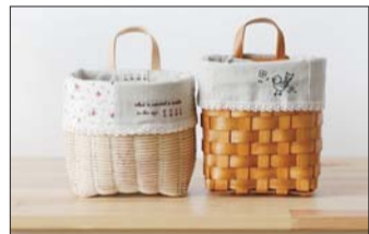
据说很多女生都把这个当做饭兜袋哦!