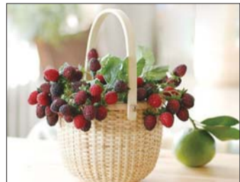
小小的藤编竹篮,圆形小巧。