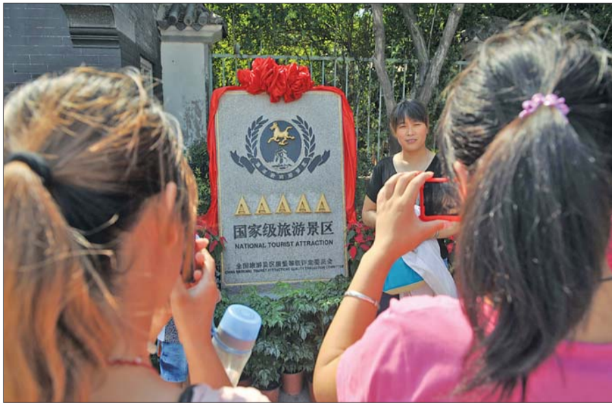
19日,“天下第一泉”国家5A级景区的标志牌引来众多游客留影。

济南市园林部门表示,在天下第一泉官方网站上,“虚拟旅游”项目通过场景角度的转换,就可以感受园区景色。比如选择大明湖“司家码头”景点,就可以360度观赏司家码头的景色。不少市民也建议,“天下第一泉”景区虚拟旅游,应该像“虚拟紫禁城”一样,注册一个人物,可以随意在景区游览,将各个景点连贯起来,像是身临其境一样。