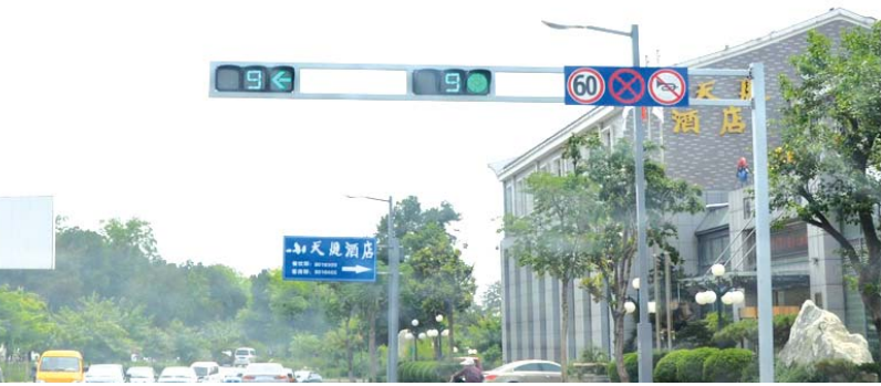
环山路红门路口信号灯增设倒计时功能示意图。

学增设学校驻地标志等。 目前环山路各路口都不具有倒计时功能,倒计时信号灯提前告知路口红绿灯信号时间,驾驶员能够合理安排停车或者起步时间,提高路口通行率。改造信号灯由单点式控制升级为联网控制,实现信号灯在交通高峰期根据路口交通流量实现自适应配时功能,以及远程控制“绿波带”功能。