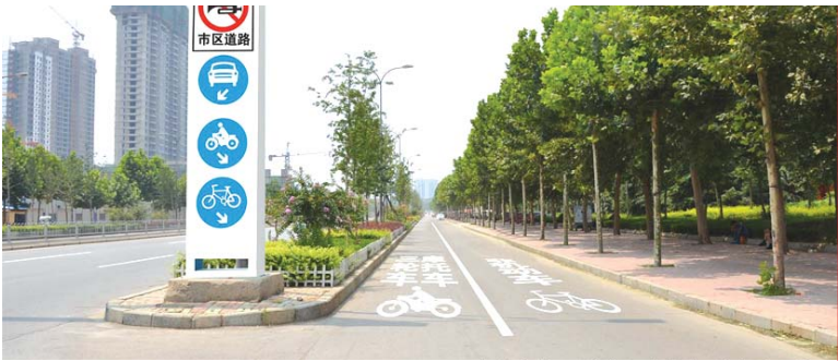
泰山大街开辟摩托车道。