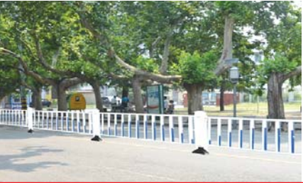
青年路护栏效果图。

离护栏。 孔祯说,东岳大街和青年路路口,之前在南北方向设置非机动车等待区,绿灯一亮可以提前放行,因为电动车等速度都较快,绿灯后很快通过路口,不影响机动车通行。路口设置提前调头开口,缓解左转车辆压力。 下一步计划在青年路设置中间护栏,高度约1.2米,能防止学生翻越。从岱宗大街至灵山东大街沿线计划设置7处机动车出口,分别是岱宗大街路口、岱庙北街路口、老市委、东岳大街路口、财源大街路口、洼子街路口、灵山东大街路口。在泰安一中和北实小门口,设置两处行人过街开口。