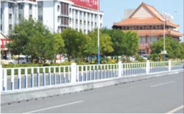
东岳大街西段设置护栏效果图。

东岳大街是横贯泰城东西的交通主干道,东起莱泰高速公路与天烛峰路相接,西与104国道相连。沿线建有泰山火车站、汽车站、医院、大型商场、行政机关、休闲场所等大量重要设施,也是外地来泰车辆进入泰安市区的必经通道。东岳大街改造包括标线复新、标志牌升级改造和增设中心隔离护栏。 孔祯说,东岳大街西段计划加装路中护栏,采用水泥底座,相对结实,高度在1.1米左右。从龙潭路至长城西路路口,设置机动车出口14处,分别在龙潭路口、站西街路口、徕徕峰路口、建设大厦、盐业大厦、科山路口、新汽车站、迎胜路口、望岳东路口、望岳西路口、御碑楼路口、长城路口(东、西),