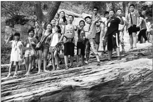
孩子们在晒经石上。