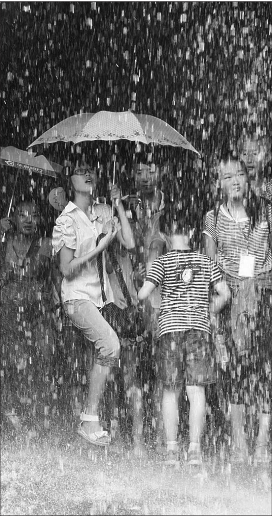
孩子们走出水帘洞。