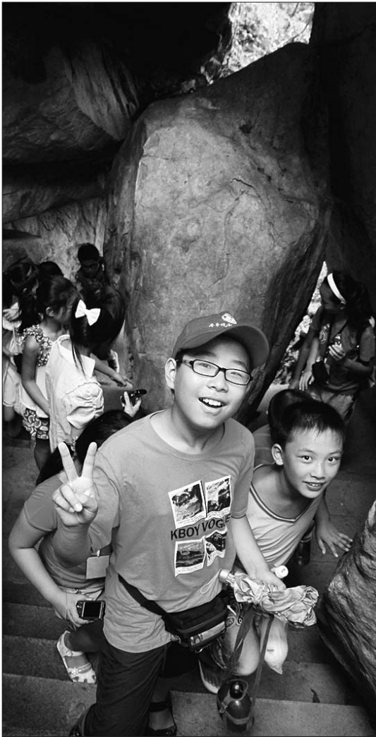
孩子们穿过马头石。