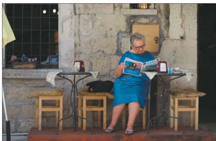
▲一位老人走出家门在路边喝杯咖啡看看杂志,生活可以慢慢地去品味。