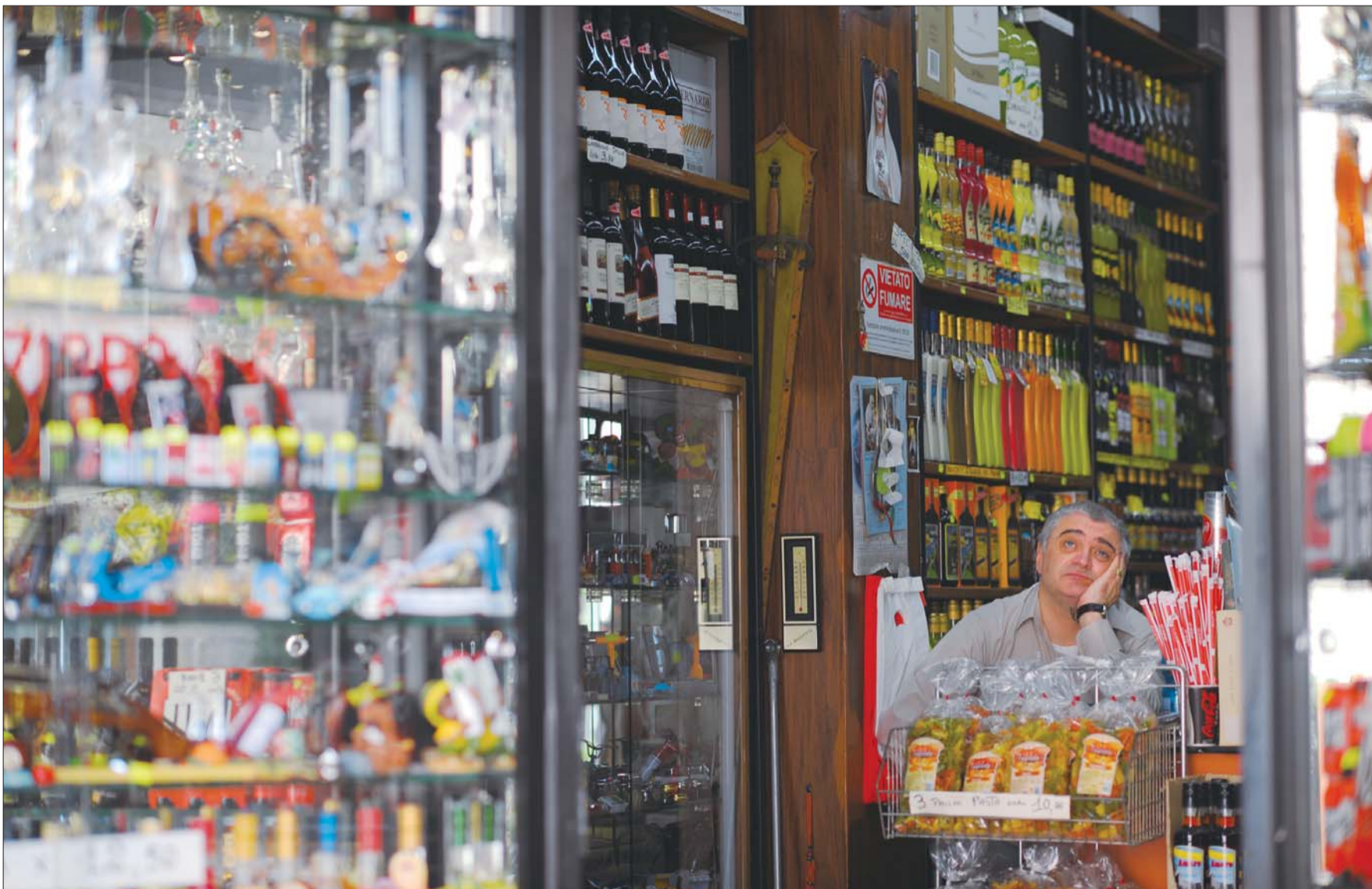
▲一名中年男子坐在自家店铺里若有所思,充分享受属于自己的时光。