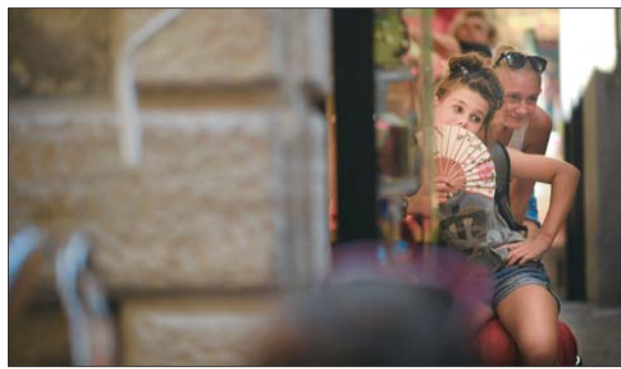
▲慵懒的少女手拿扇子望着门外,不知是什么吸引了她的目光。