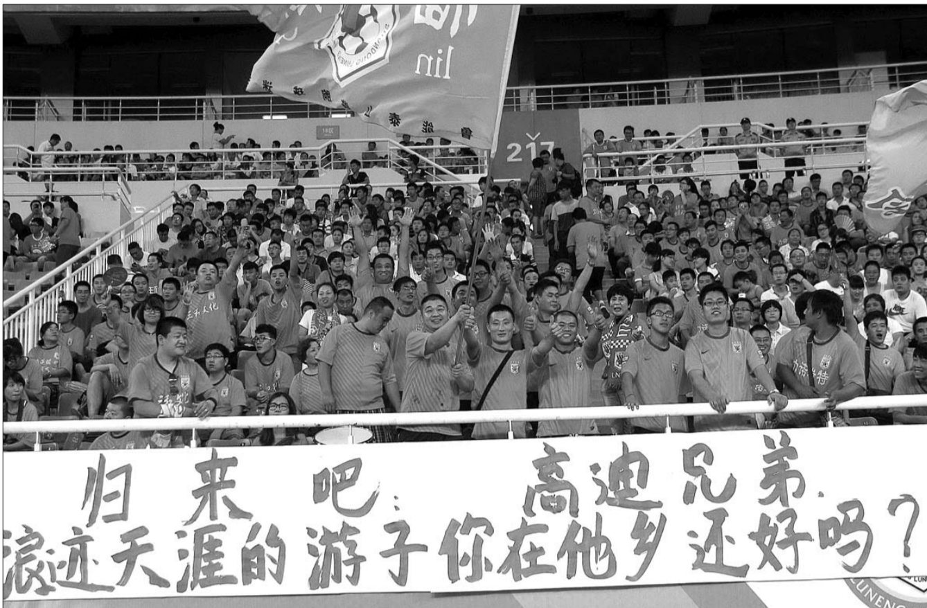
山东球迷打出横幅希望高迪回归鲁能。

从2006年起,新浪率先成为欧足联独家新媒体合作伙伴,在中国大陆地区引入欧冠赛事的直播和点播视频,成为网友观看欧冠赛事最便捷的网络平台。除了欧冠,新浪作为中国大陆地区首家直播英超的互联网平台,今年将连续第8个赛季视频直播点播英超比赛,包括曼联、阿森纳、切尔西和利物浦四大豪门在内的每周4场英超焦点赛事。(新体)