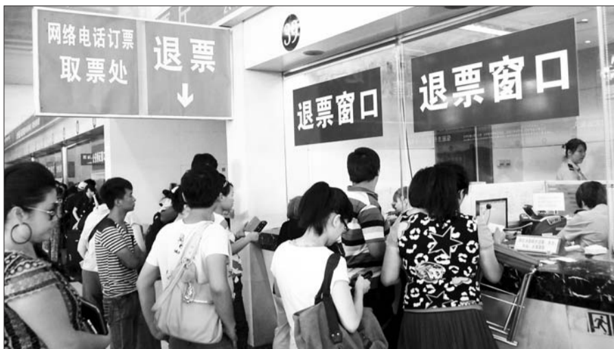
8月26日,旅客在北京火车站售票大厅办理退票业务。