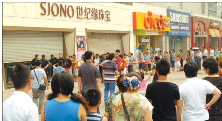
▲今年端午,世纪缘推出的优惠活动引发3万人抢购。本次“厂价直销”预计人更多。