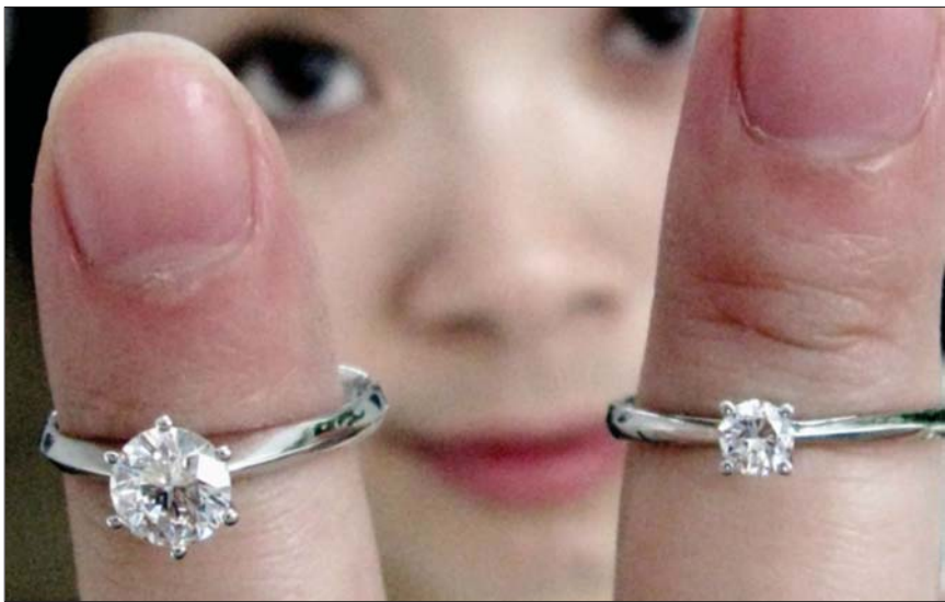
▲周末到本报，用30分钻戒(右边的)的钱，可以买到半克拉(左边)的大钻戒。