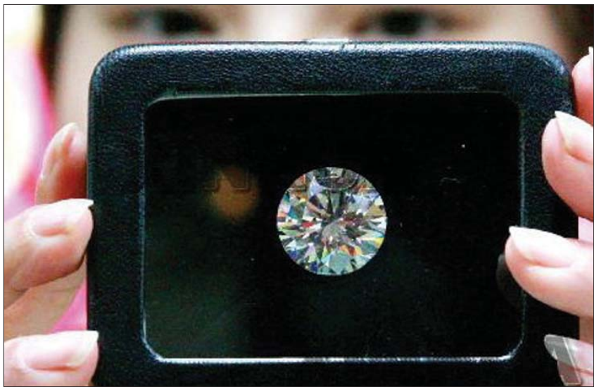
▲市面7万多元的国际GIA克拉大钻，周末到报社，仅需2万多。