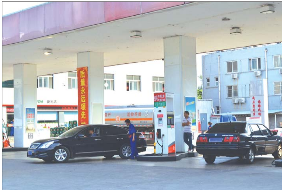
东岳大街一处加油站紧邻铁路职工宿舍。

开展油气回收治理,不仅能大量减少挥发性有机物的排放,有利于空气质量的改善,还能有效节约资源。