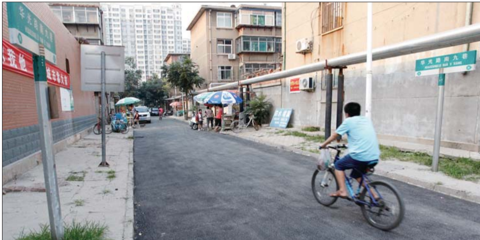
华光路南九巷道路施工已完成。

近日,张店科苑街道办事处对瑞苑社区内6条街巷7000多平方米的道路进行了整修,并在修缮道路的同时,对瑞苑社区的私搭乱建、占道经营等问题进行了有序规划治理,并为社区居民安装了健身器材。