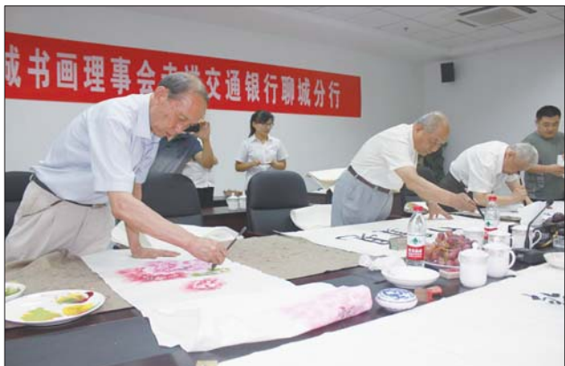
书画家们笔会现场创作。

文企联姻，书画搭台，服务客户，共创发展。8月22日下午，本报《水城书画》理事会的书画名家们应邀来到交通银行聊城分行，与交通银行聊城分行的贵宾客户及水城书画爱好者们举行了一场笔会联谊活动。