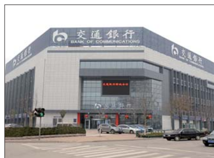
交通银行聊城分行。