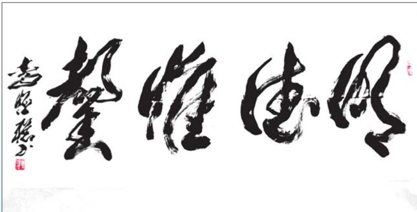
著名书法家、原聊城市文化局局长李恒聪作品。