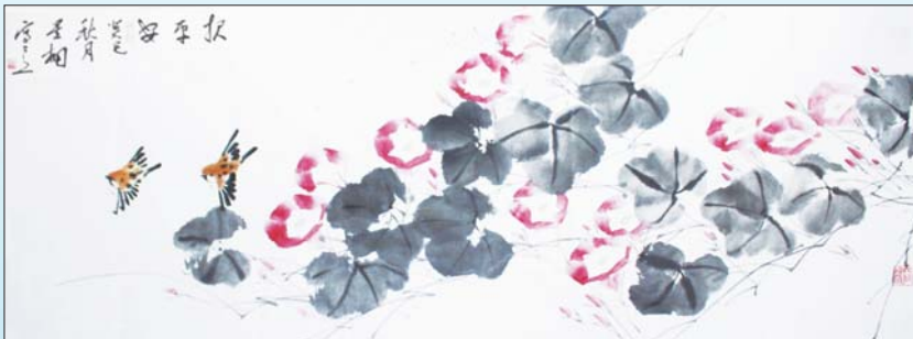
著名画家、聊城大学美术系国画教研室主任王好军作品。