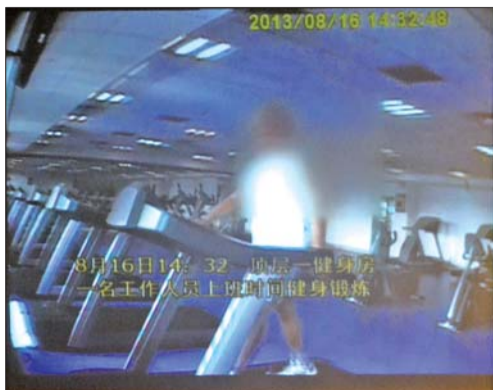
某单位工作人员上班时间健身。